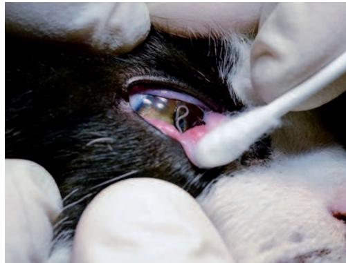
Figura 7. Gato con Thelazia .

zonas con prevalencia importante de thelaziosis, fueron: