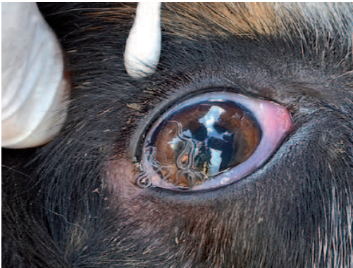
Figura 6. Perro con una infestación masiva por Thelazia .